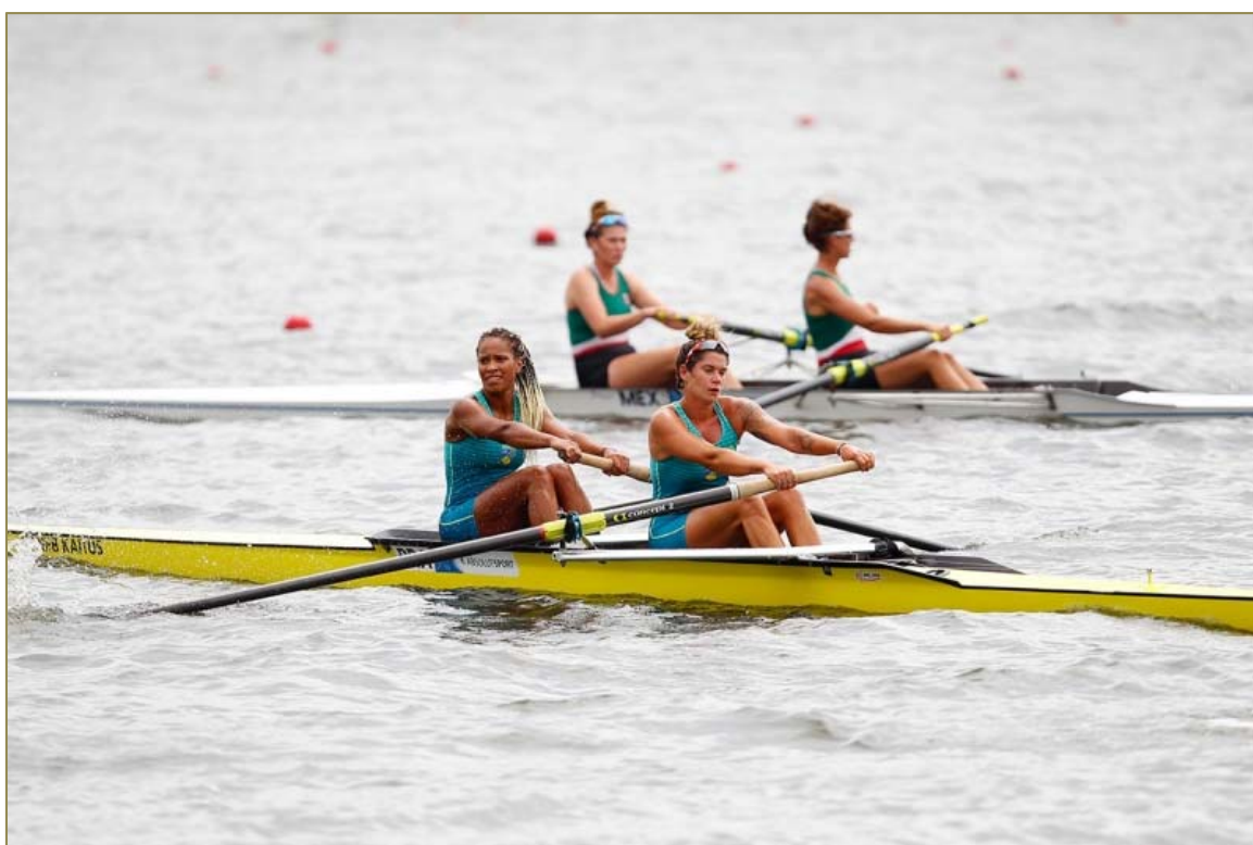
Remadoras do Dois Sem Feminino durante a prova final.

CONFED. BRASILEIRA DE REMO Brazilian Rowing Federation Filiada à FISA – World Rowing E-mail: cbr@remobrasil.com www.remobrasil.com