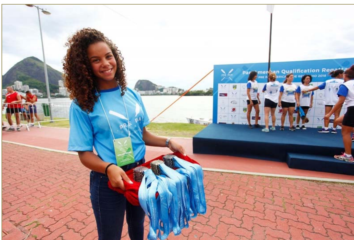
Voluntária com camiseta do evento se preparando para a entrega das medalhas.

CONFED. BRASILEIRA DE REMO Brazilian Rowing Federation Filiada à FISA – World Rowing E-mail: cbr@remobrasil.com www.remobrasil.com