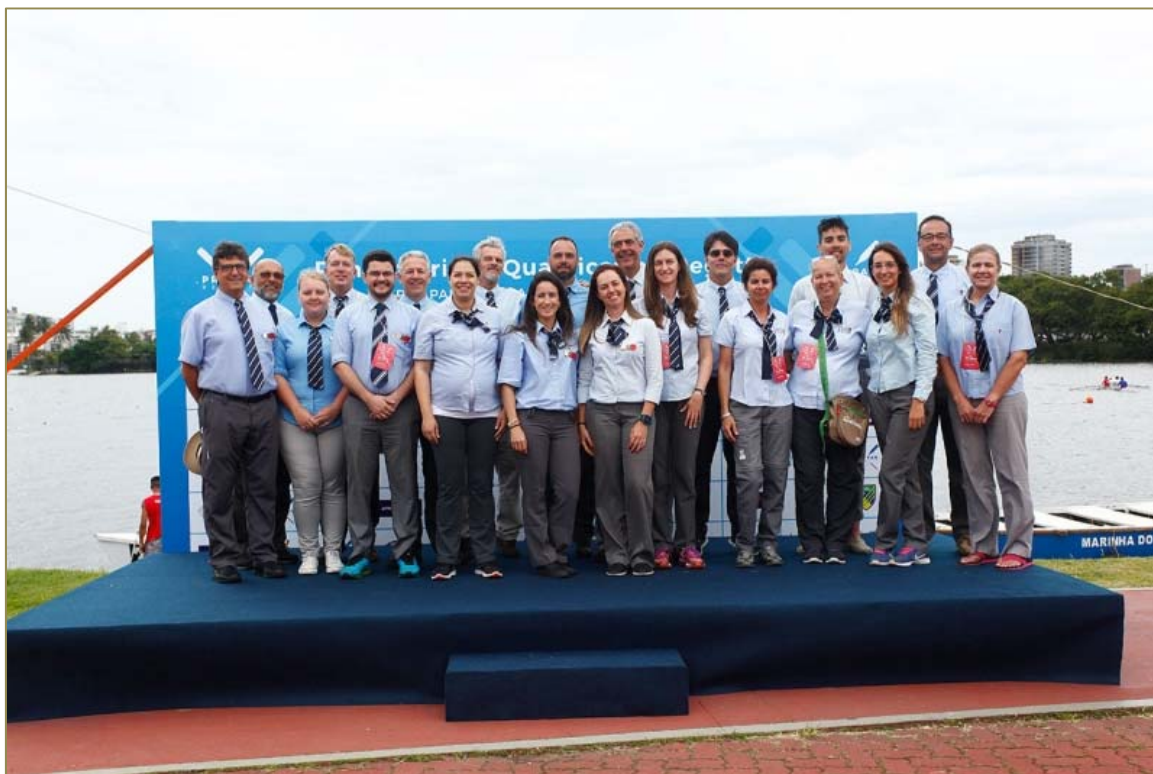
Equipe de arbitragem reunida em frente ao pódio do campeonato.