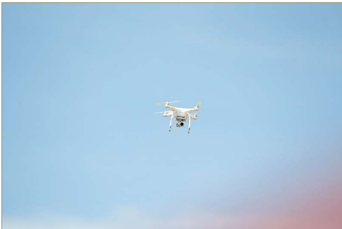
Drone utilizado para fazer a transmissão ao vivo das provas.