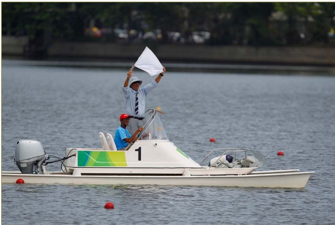
Árbitro em lancha acompanhando e sinalizando a realização das provas.