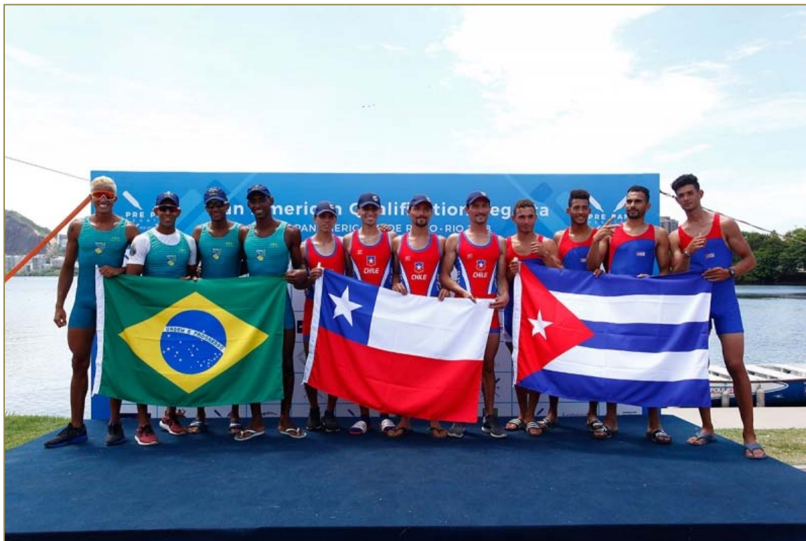
Barco Quatro Sem Masculino Peso Leve recebendo a medalha de prata.