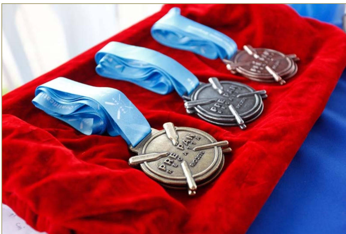
Medalhas de ouro, prata e bronze produzidas para o evento.

CONFED. BRASILEIRA DE REMO Brazilian Rowing Federation Filiada à FISA – World Rowing E-mail: cbr@remobrasil.com www.remobrasil.com