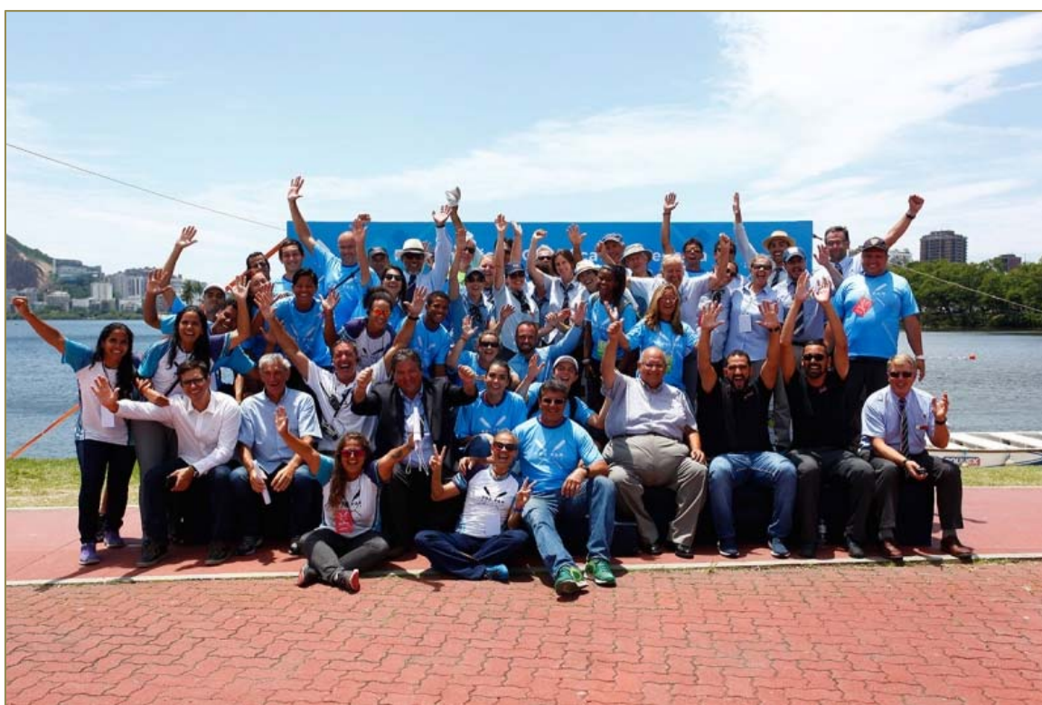
Equipe do evento formada pelos organizados e pelos voluntários.

CONFED. BRASILEIRA DE REMO Brazilian Rowing Federation Filiada à FISA – World Rowing E-mail: cbr@remobrasil.com www.remobrasil.com