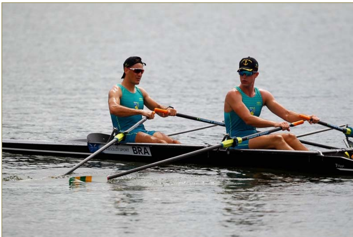
Atletas dos Double Skiff Masculino durante a prova Final.