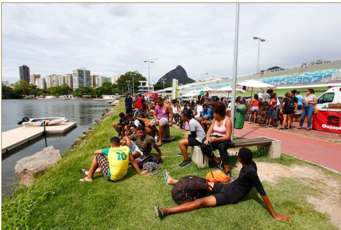
Público assistiu à chegada dos barcos em frente ao Estádio de Remo.

CONFED. BRASILEIRA DE REMO Brazilian Rowing Federation Filiada à FISA – World Rowing E-mail: cbr@remobrasil.com www.remobrasil.com