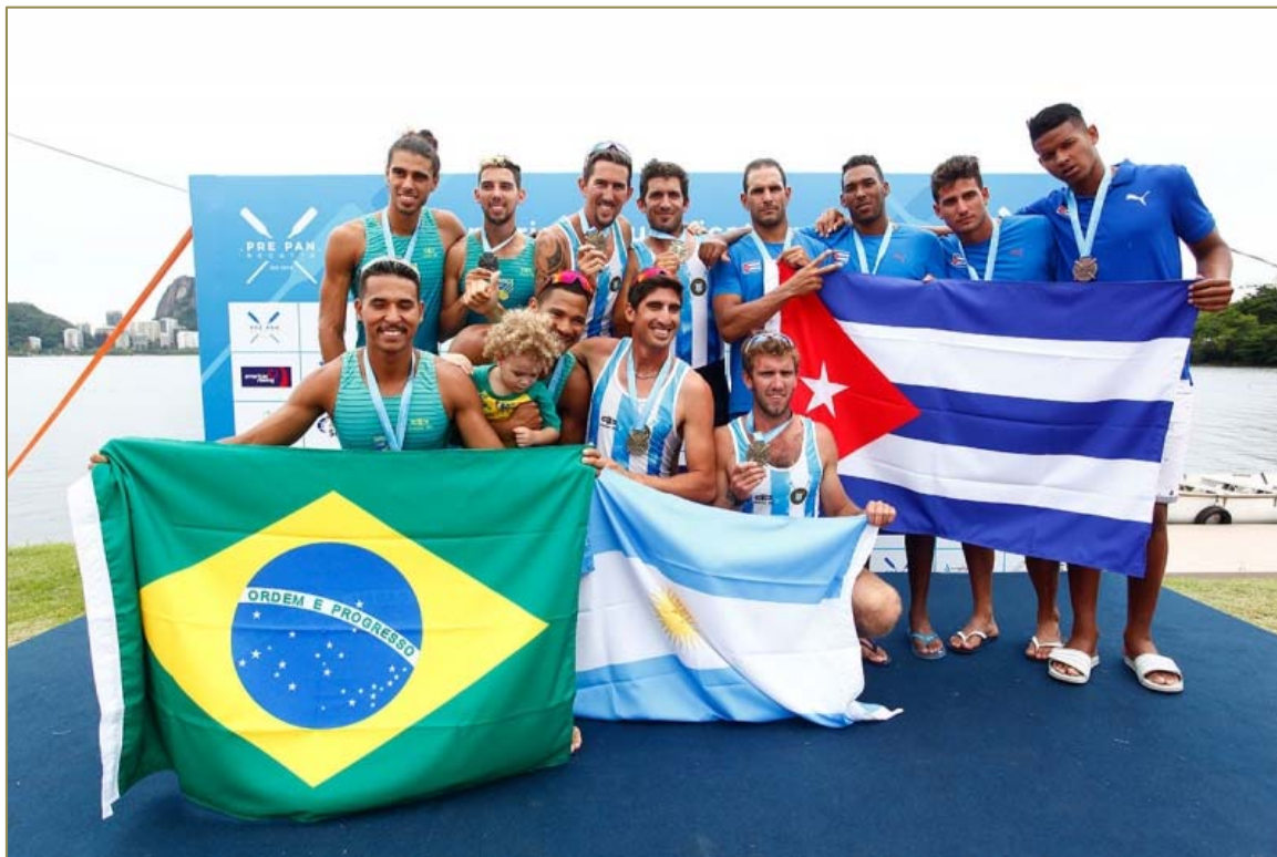
Barco Quatro Sem Masculino comemora no pódio a medalha de prata.